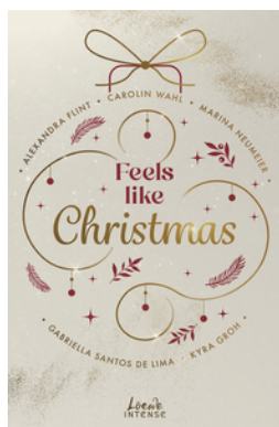
Feels like Christmas