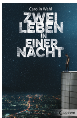
Zwei Leben in einer Nacht