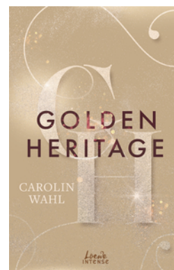
Golden Heritage (Crumbling Hearts, Band 2)