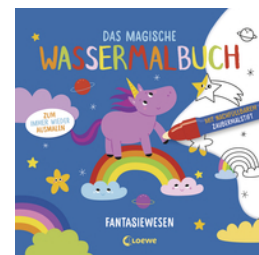
Das magische Wassermalbuch - Fantasiewesen