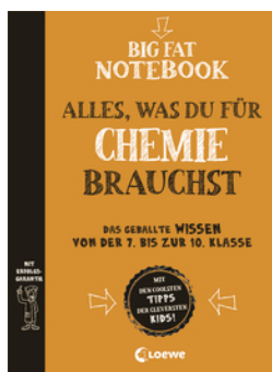
Big Fat Notebook Chemie - Alles, was du für Chemie brauchst - Das geballte Wissen von der 7. bis zur 10. Klasse