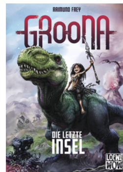
Groona - Die letzte Insel