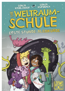
Die Weltraumschule (Band 1) - Erste Stunde: Alienkunde