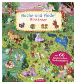
Suche und finde! Einhörner