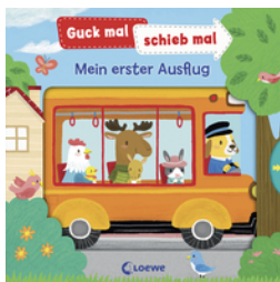
Guck mal, schieb mal! - Mein erster Ausflug