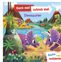
Guck mal, schieb mal! Suche und entdecke - Dinosaurier