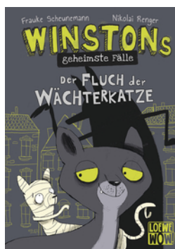
Winstons geheimste Fälle (Band 1) - Der Fluch der Wächterkatze