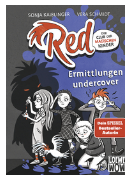
Red - Der Club der magischen Kinder (Band 2) - Ermittlungen undercover