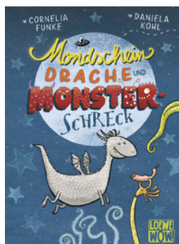
Mondscheindrache und Monsterschreck