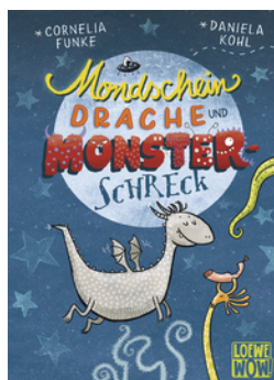
Mondscheindrache und Monsterschreck