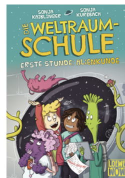
Die Weltraumschule (Band 1) - Erste Stunde: Alienkunde