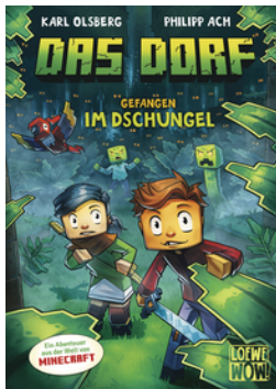
Das Dorf (Band 3) - Gefangen im Dschungel