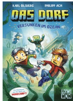
Das Dorf (Band 5) - Versunken im Ozean