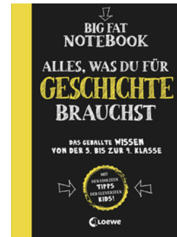
Big Fat Notebook - Alles, was du für Geschichte brauchst