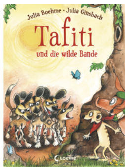
Tafiti und die wilde Bande (Band 20)