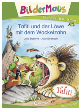
Bildermaus - Tafiti und der Löwe mit dem Wackelzahn