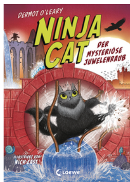
Ninja Cat (Band 4) - Der mysteriöse Juwelenraub