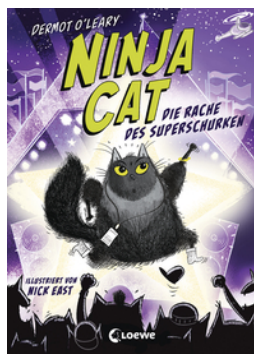
Ninja Cat (Band 3) - Die Rache des Superschurken