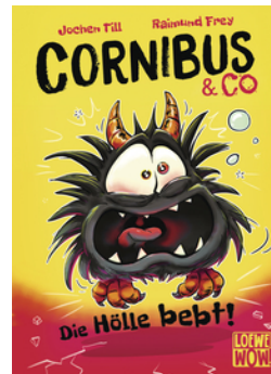
Cornibus & Co (Band 3) - Die Hölle bebt!