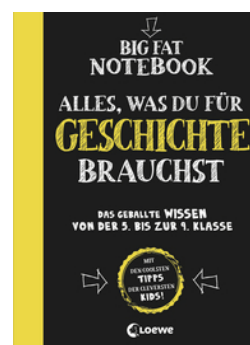
Big Fat Notebook - Alles, was du für Geschichte brauchst