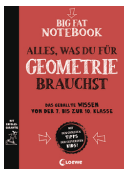
Big Fat Notebook - Alles, was du für Geometrie brauchst