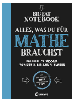
Big Fat Notebook - Alles, was du für Mathe brauchst - Das geballte Wissen von der 5. bis zur 9. Klasse