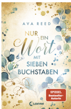
Nur ein Wort mit sieben Buchstaben