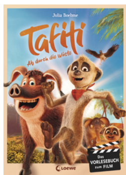
Tafiti - Ab durch die Wüste