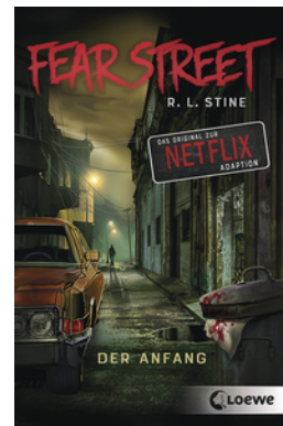
Fear Street - Der Anfang