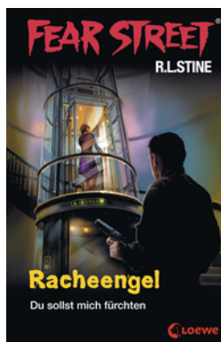
Fear Street 60 - Racheengel