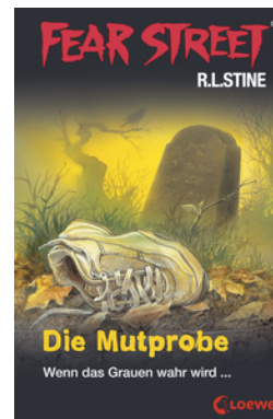
Fear Street 58 - Die Mutprobe