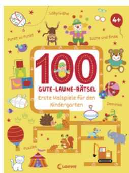
100 Gute-Laune-Rätsel - Erste Malspiele für den Kindergarten