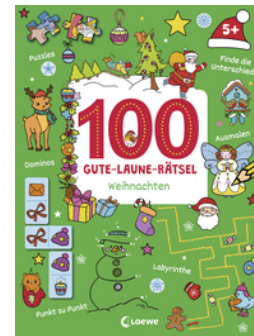
100 Gute-Laune-Rätsel - Weihnachten