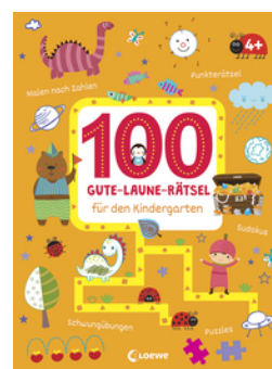
100 Gute-Laune-Rätsel für den Kindergarten