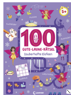
100 Gute-Laune-Rätsel - Zauberhafte Eisfeen