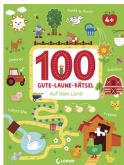
100 Gute-Laune-Rätsel - Auf dem Land