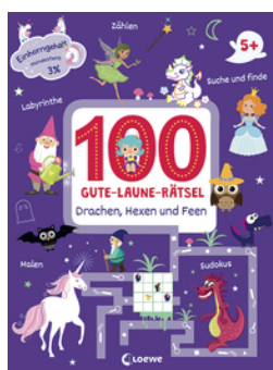
100 Gute-Laune-Rätsel - Drachen, Hexen und Feen