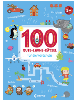
100 Gute-Laune-Rätsel für die Vorschule