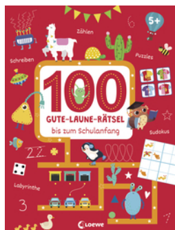
100 Gute-Laune-Rätsel bis zum Schulanfang