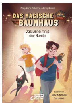
Das magische Baumhaus (Comic-Buchreihe, Band 3) - Das Geheimnis der Mumie