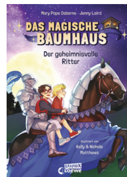
Das magische Baumhaus (Comic-Buchreihe, Band 2) - Der geheimnisvolle Ritter