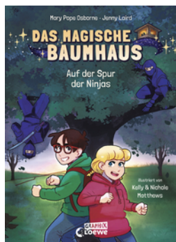
Das magische Baumhaus (Comic-Buchreihe, Band 5) - Auf der Spur der Ninjas