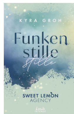
Funkenstille (Sweet Lemon Agency, Band 3)