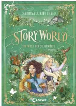
StoryWorld (Band 2) - Im Wald der Silberwölfe