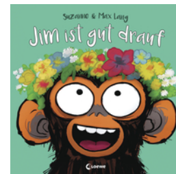
Jim ist gut drauf