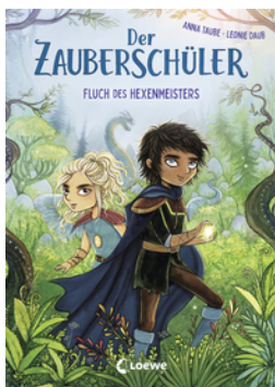
Der Zauberschüler (Band 1) - Fluch des Hexenmeisters