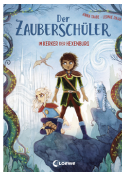
Der Zauberschüler (Band 5) - Im Kerker der Hexenburg