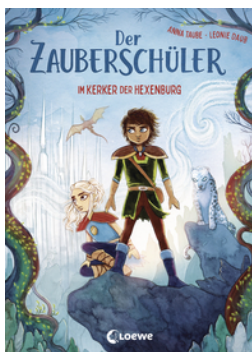
Der Zauberschüler (Band 5) - Im Kerker der Hexenburg