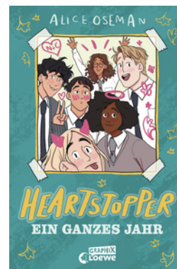
Heartstopper - Ein ganzes Jahr (Yearbook)