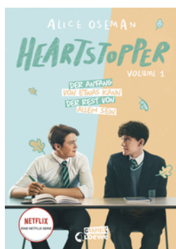
Heartstopper Volume 1