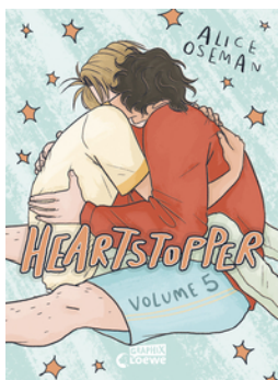
Heartstopper Volume 5 (deutsche Hardcover-Ausgabe)