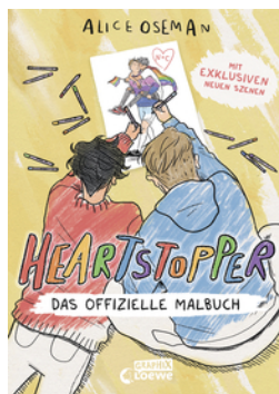
Heartstopper - Das offizielle Malbuch