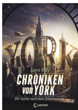
Chroniken von York (Band 1) - Die Suche nach dem Schattencode