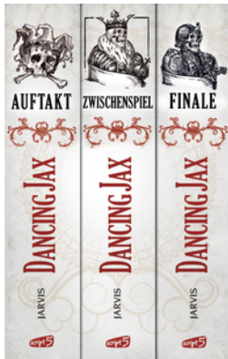
Dancing Jax - Die komplette Trilogie