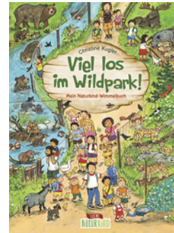
Viel los im Wildpark!