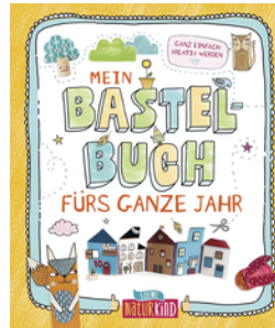
Mein Bastelbuch fürs ganze Jahr