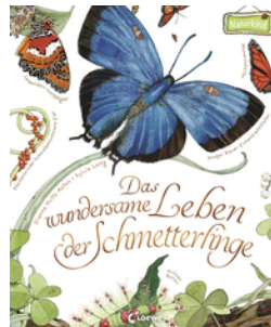
Das wundersame Leben der Schmetterlinge