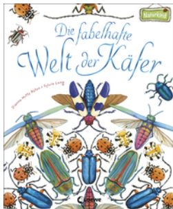
Die fabelhafte Welt der Käfer