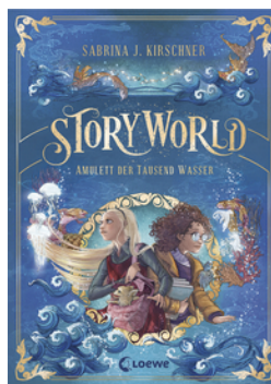
StoryWorld (Band 1) - Amulett der Tausend Wasser