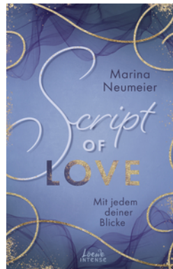
Script of Love - Mit jedem deiner Blicke (Love-Trilogie, Band 2)