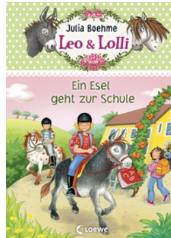
Leo & Lolli (Band 3) - Ein Esel geht zur Schule