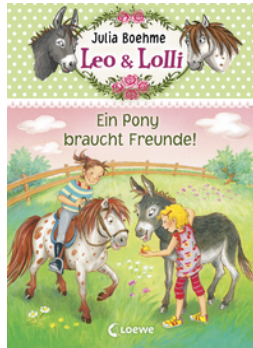
Leo & Lolli (Band 1) - Ein Pony braucht Freunde!