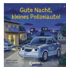
Gute Nacht, kleines Polizeiauto!