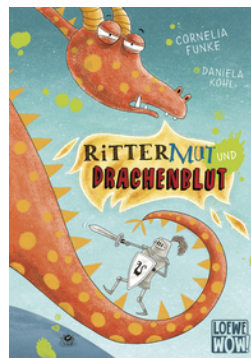
Rittermut und Drachenblut