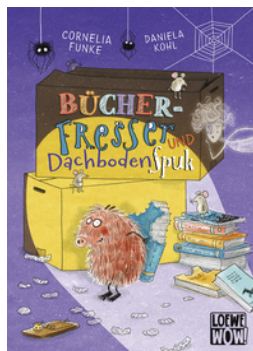
Bücherfresser und Dachbodenspuk