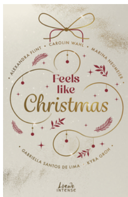
Feels like Christmas