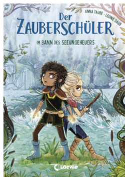
Der Zauberschüler (Band 2) - Im Bann des Seeungeheuers