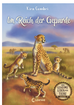
Das geheime Leben der Tiere (Savanne, Band 3) - Im Reich der Geparde