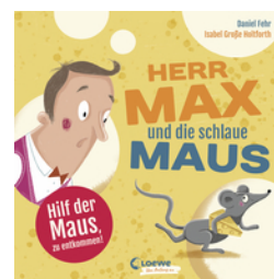
Herr Max und die schlaue Maus