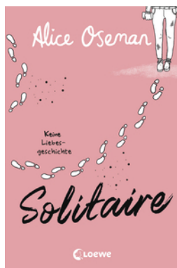
Solitaire (deutsche Ausgabe)