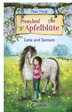
Ponyhof Apfelblüte (Band 1) - Lena und Samson