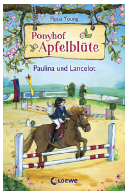
Ponyhof Apfelblüte (Band 2) - Paulina und Lancelot