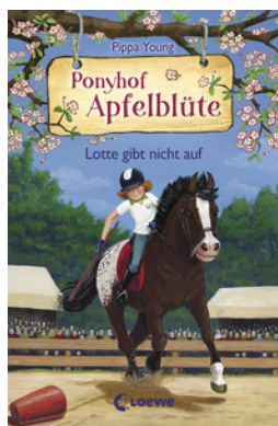
Ponyhof Apfelblüte (Band 23) - Lotte gibt nicht auf