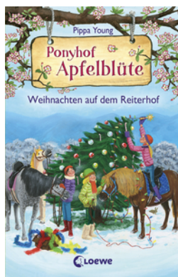
Ponyhof Apfelblüte - Weihnachten auf dem Reiterhof