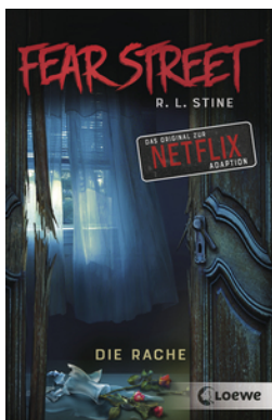
Fear Street - Die Rache