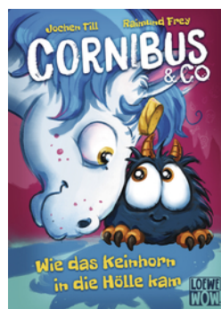
Cornibus & Co. (Band 4) - Wie das Keinhorn in die Hölle kam