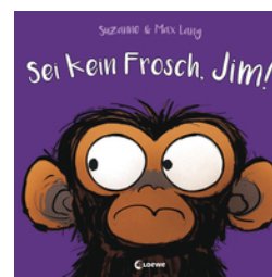
Sei kein Frosch, Jim!