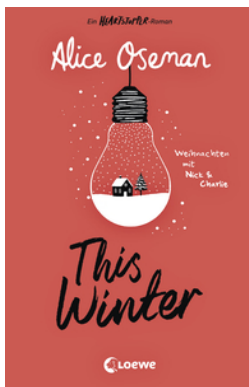
This Winter (deutsche Ausgabe)