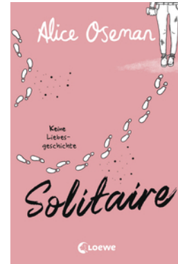
Solitaire (deutsche Ausgabe)