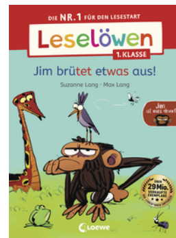
Leselöwen 1. Klasse - Jim ist mies drauf - Jim brütet etwas aus!