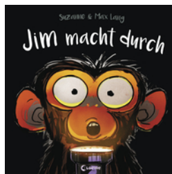
Jim macht durch