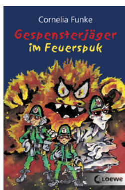
Gespensterjäger im Feuerspuk