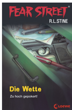
Fear Street 56 - Die Wette