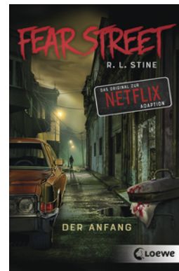
Fear Street - Der Anfang