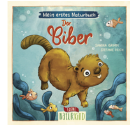
Mein erstes Naturbuch - Der Biber