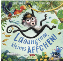
Laaangsam, kleines Äffchen!