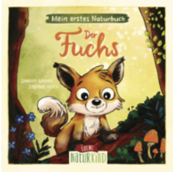
Mein erstes Naturbuch - Der Fuchs