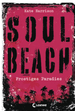
Soul Beach (Band 1) – Frostiges Paradies