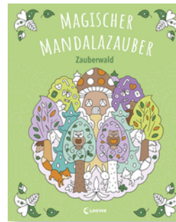
Magischer Mandalazauber - Zauberwald