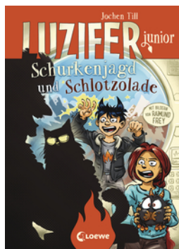
Luzifer junior (Band 14) - Schurkenjagd und Schlotzolade