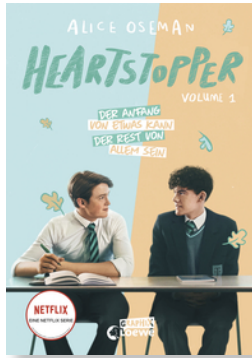
Heartstopper Volume 1